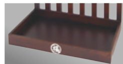
カッティングシート

比較的細かい図柄まできっちり入ります。版を必要としないので小ロットに最適。(校正費用等必要)