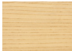
栓 (せん) 広

辺材は灰白色で、心材は帯黄紅褐色。硬く耐朽性にも優れ、木目が力強く美しい事から古くから日本国内で最良の広葉樹とされている。お盆、お椀などの漆器の材料として使用され、価値が高いとされている。