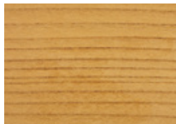
ケヤキ (樺) 広

焼杉は杉の表面をこがし、炭化状にすることで耐火性を向上させたもので、鍋敷きなど様々な製品に使用されている。